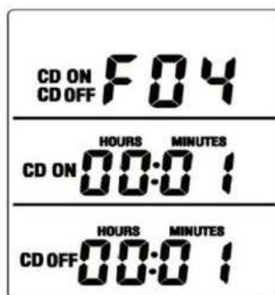
Be-, majd kikapcsolás késleltetés