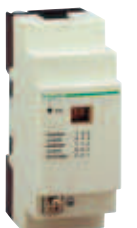
TWD XCA T3RJ